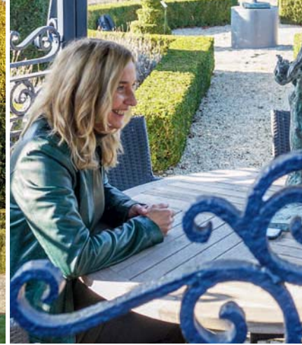
Rustig even napraten over wat we hebben gezien.