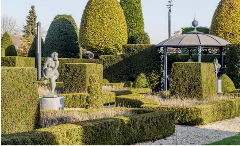
Beeldentuin Giardino is strak gesnoeid.